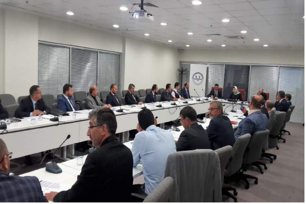
Çalıştay Salonu ve Oturumlar